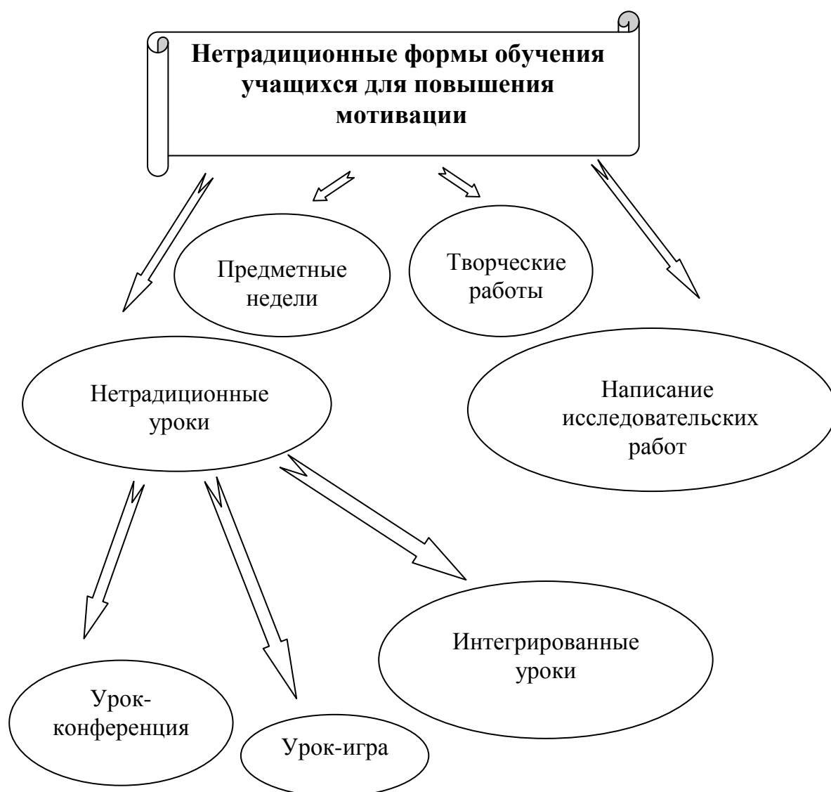
Рисунок 7.2 – Система нетрадиционных форм обучения

мы необходим системный подход. На рисунке 7.2 представлена система нетрадиционных форм обучения обучающихся по развитию мотивации к изучению биологии. Разные варианты нетрадиционных форм обучения предоставляют каждому обучающемуся возможность выбора. А свобода выбора повышает мотивацию к успешному выполнению выбранного задания. Учащиеся с хорошо развитым вкусом, пространственным мышлением охотно выполняют задания в виде рисунков, стараются придумывать свои рисунки, схемы.